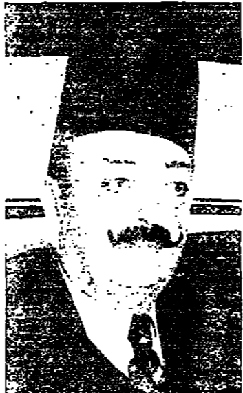
أرسلان: هو مارس وأنا احب الفرسان

● الاعتقد ان الحل للجنوب سيكون داخليا لا ؟ ● طبعاً هذا بلنا ، ولكن بغير ما يخفون من تواجد اخواننا على الحدود ، بغير ما يساهم ذلك في حل القضية ، ان كان دماراً وخراباً وضحايا . ● هل يحدث مع الرئيس سركيس قضية بناء الجيش ؟ ● اولاً لقد هنتت الرئيس سركيس على حسن اختياره تسليح الجيش الجديد ، لا امره جيداً ، فهو من خبرة الضباط وليس من مضمنا سياسيات ، وهو مارس وأنا احب الفرسان . ● ما هي الخطوة التالية بعد تعيين قائد الجيش ؟ ● الخطوة التالية هي تكوين جيش جديد ، منسجم ومنضبط يعمل لصحة البلد ، ولا يتأثر بالسياسات المحلية ، الرئيس كارتر . ● الاعتقد ان الحل للجنوب سيكون داخليا لا ؟ ● طبعاً هذا بلنا ، ولكن بغير ما يخفون من تواجد اخواننا على الحدود ، بغير ما يساهم ذلك في حل القضية ، ان كان دماراً وخراباً وضحايا . ● هل يحدث مع الرئيس سركيس قضية بناء الجيش ؟ ● اولاً لقد هنتت الرئيس سركيس على حسن اختياره تسليح الجيش الجديد ، لا امره جيداً ، فهو من خبرة الضباط وليس من مضمنا سياسيات ، وهو مارس وأنا احب الفرسان . ● ما هي الخطوة التالية بعد تعيين قائد الجيش ؟ ● الخطوة التالية هي تكوين جيش جديد ، منسجم ومنضبط يعمل لصحة البلد ، ولا يتأثر بالسياسات المحلية ، الرئيس كارتر .